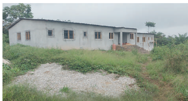
Construction d'un bâtiment administratif au collège moderne de Grand Morié