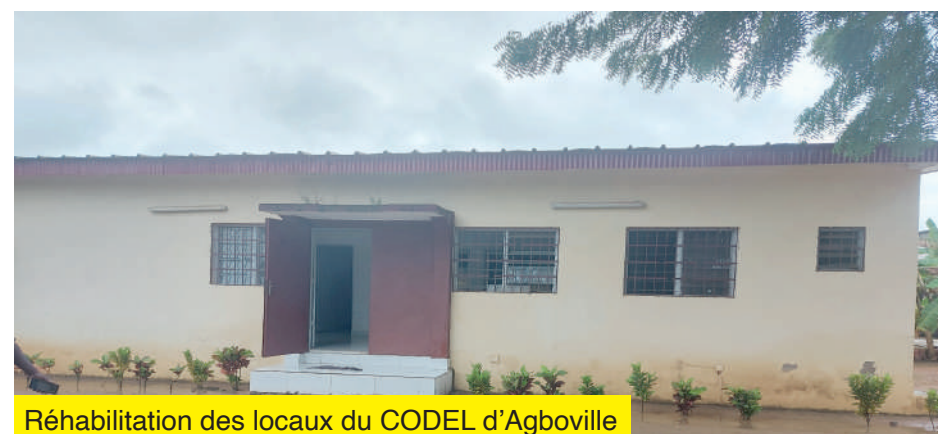
Réhabilitation des locaux du CODEL d'Agboville