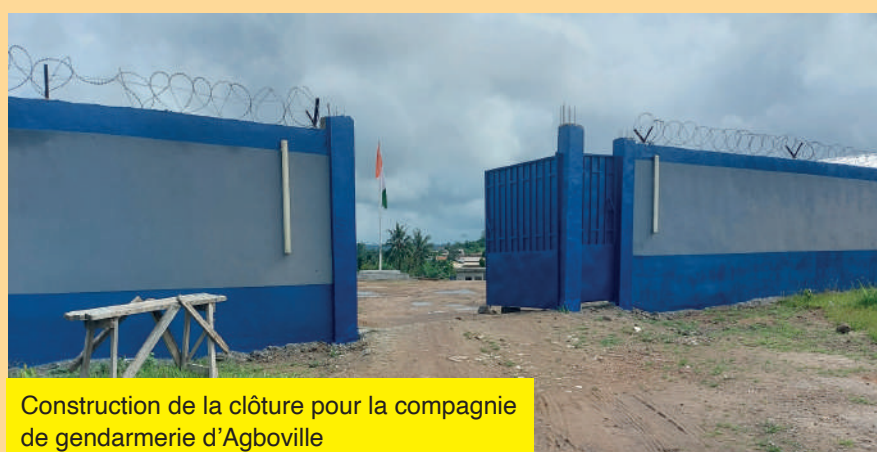
Construction de la clôture pour la compagnie de gendarmerie d'Agboville

Construction d'un logement de sage-femme à Bakanou B : Niveau de réalisation: couverture réalisée