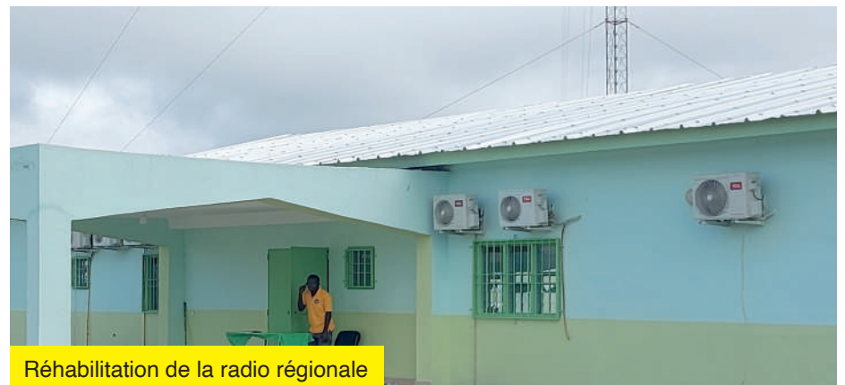
Réhabilitation de la radio régionale