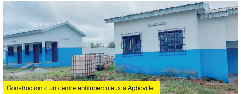
Construction d'un centre antituberculeux à Agboville

Construction d'un logement de sage-femme à Bakanou B : Niveau de réalisation: couverture réalisée