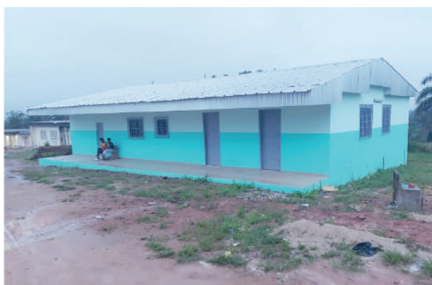
Réhabilitation du bâtiment administratif du lycée 2 d'Agboville