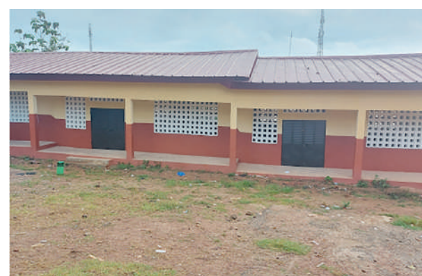
École maternelle d'Adahou

Construction d'un bâtiment administratif au collège moderne de Taabo village: Niveau de réalisation: charpente métallique en cours de pose