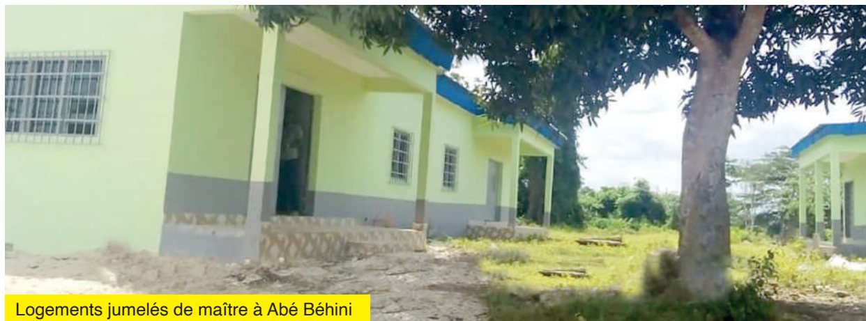
Logements jumelés de maître à Abé Béhini

Construction du bâtiment administratif du collège d'Aboudé ; Construction d'un bâtiment de 4 classes +bureau au collège d'Aboudé ; Réhabilitation d'un bâtiment de 4 classes au lycée moderne d'Azaguié ; Construction de 3 classes+bureau à Léléblé ; Réhabilitation de 9 classes +bureau à l'EPP de Faitaikro ; Achèvement de 4 classes à l'EPP d'Oress Krobou 3