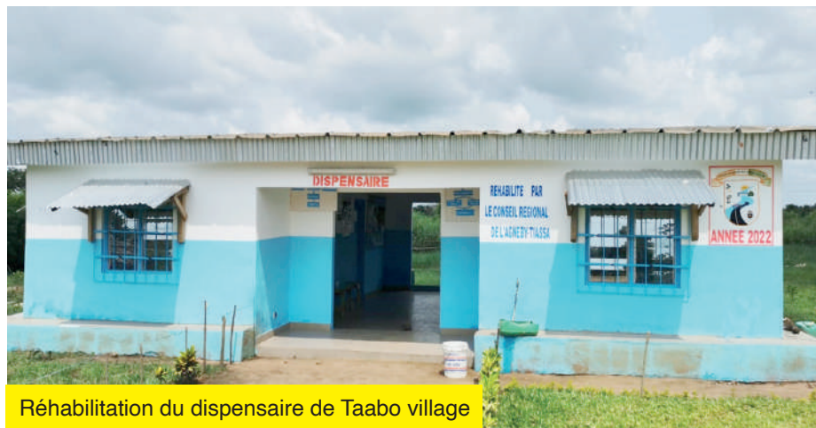
Réhabilitation du dispensaire de Taabo village