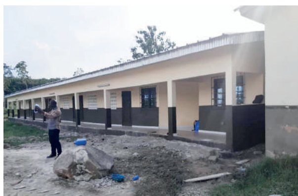
Construction de 4 classes +bureau au collège moderne de Katadji