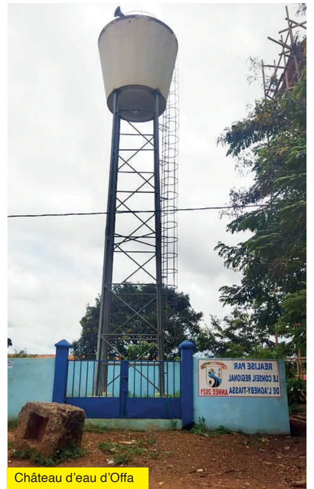
Château d'eau d'Offa

Raccordement électrique du collège d'Aboudé-Mandéké : Niveau de réalisation: planting des poteaux achevé, raccordement terminé