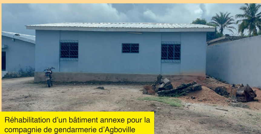
Réhabilitation d'un bâtiment annexe pour la compagnie de gendarmerie d'Agboville