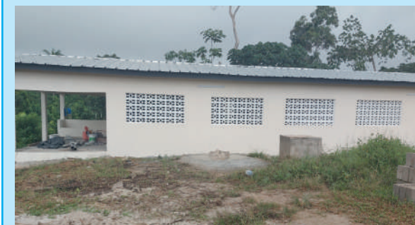
Unité de transformation de manioc de Grand Yapo