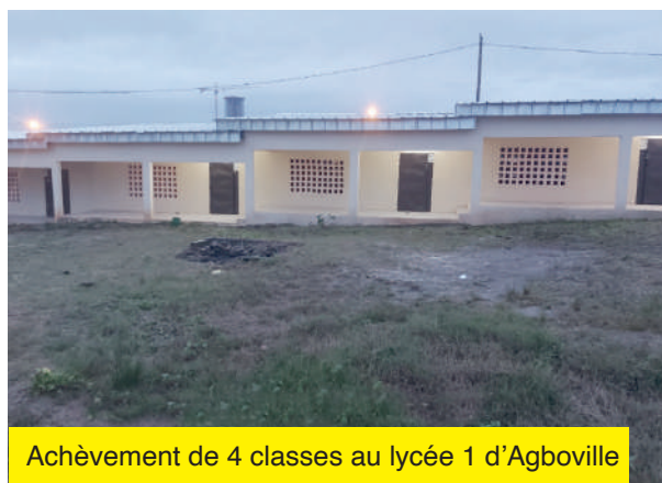
Achèvement de 4 classes au lycée 1 d'Agboville