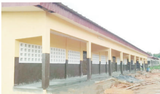
Construction de 4 classes au collège moderne de Binao