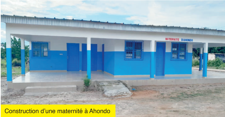
Construction d'une maternité à Ahondo

Construction d'un logement d'infirmier à Deniskro; Construction d'un dispensaire à Kotchimpo ; Equipement du dispensaire d'Arragué en matériel biomédical ; Réhabilitation d'un dispensaire à Taabo village