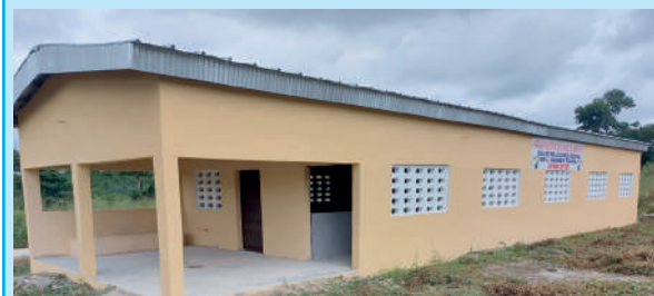
Unité de transformation de manioc de Grand Morié