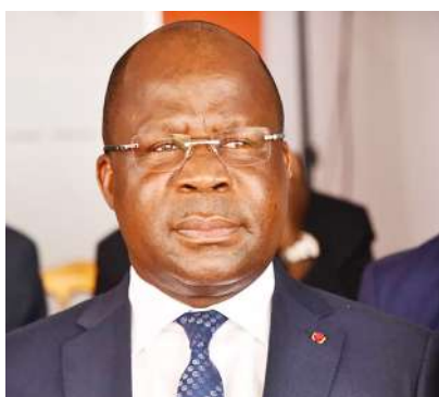
Pierre N'gou DIMBA Ministre de la Santé, de l'Hygiène Publique et de la Couverture Maladie Universelle, Président du Conseil Régional de l'Agneby-Tiassa