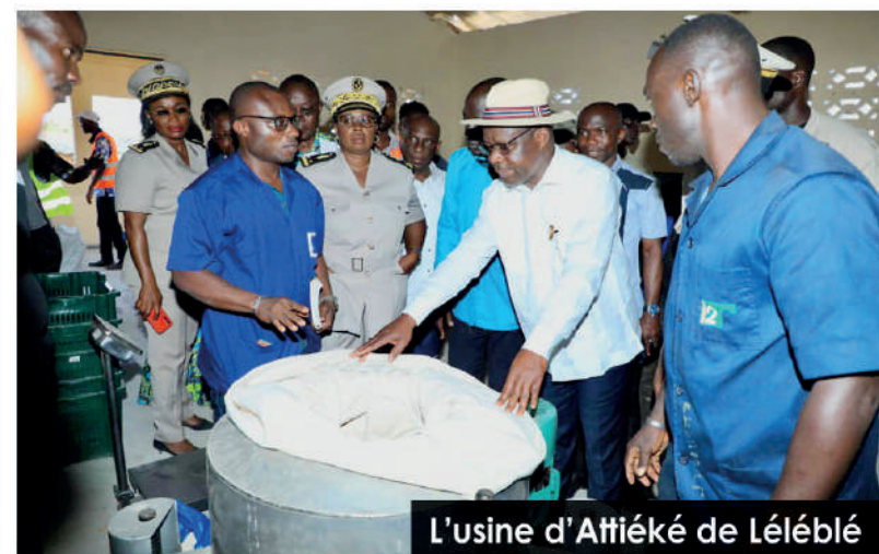
L'usine d'Attiéké de Léléblé