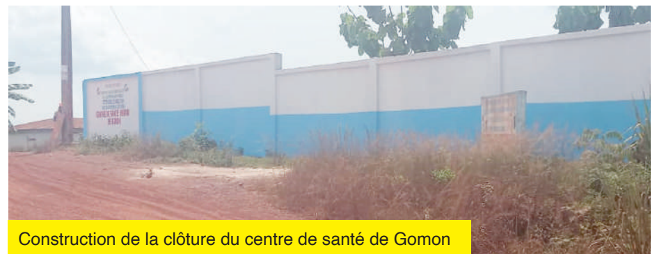
Construction de la clôture du centre de santé de Gomon