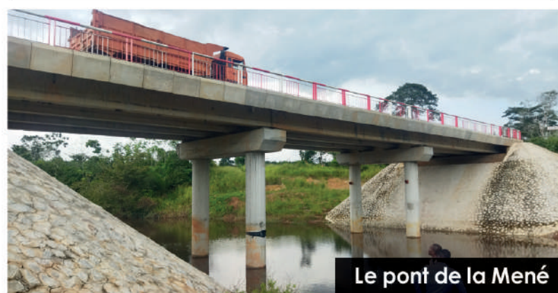
Le pont de la Mené