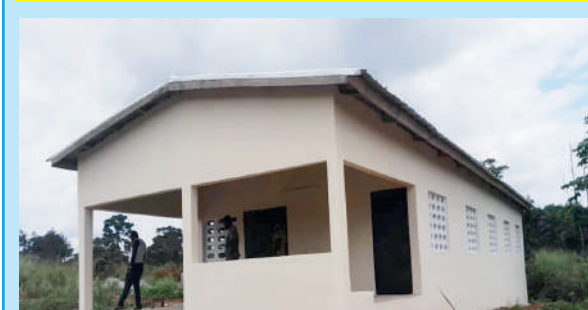
Unité de transformation de manioc de Gomon

Construction d'une unité de transformation de manioc à Attobrou: Niveau: chainage bas