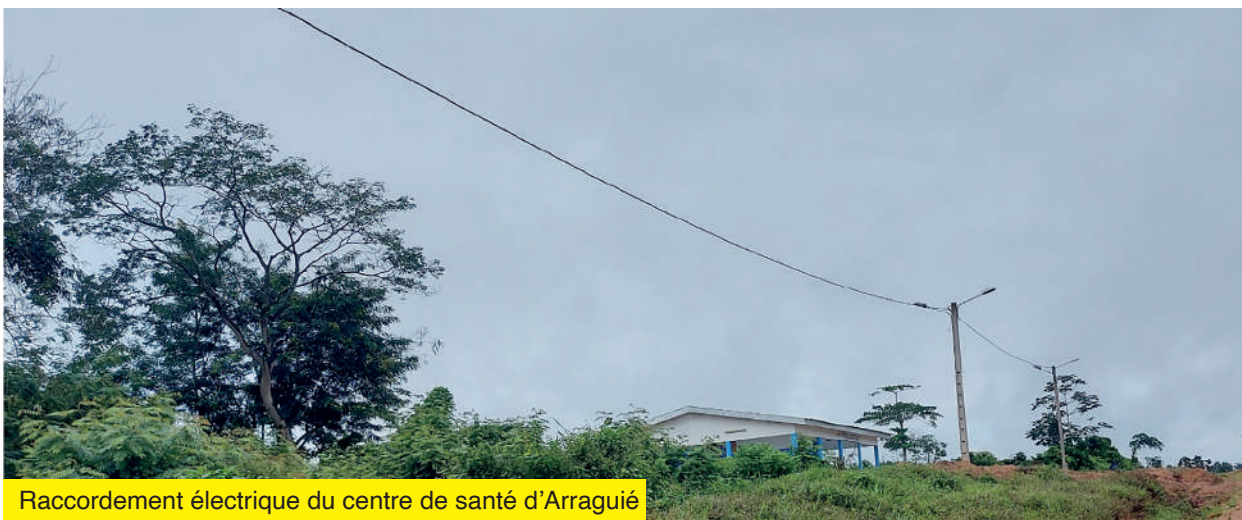
Raccordement électrique du centre de santé d'Arragué

Electrification du village de Niamazra, Raccordement électrique du centre de santé d'Allany Renforcement du réseau hydraulique d'Odoguié Réalisation de deux (02) forages à Attobrou Raccordement en eau potable du collège d'Aboudé