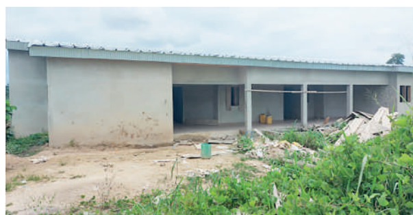
Construction d'un bâtiment administratif au collège moderne de Grand Morié