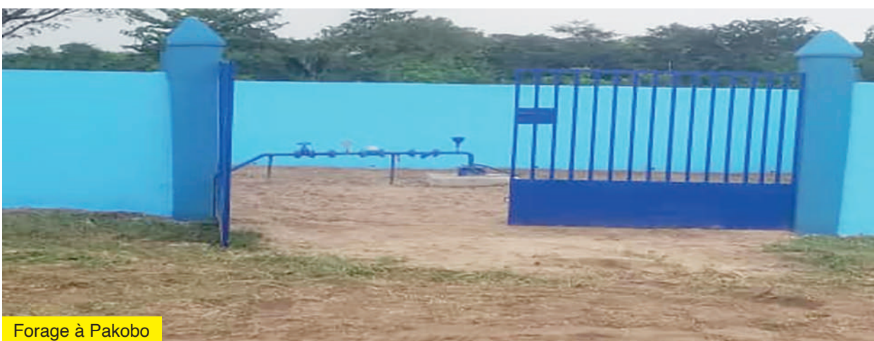
Forage à Pakobo